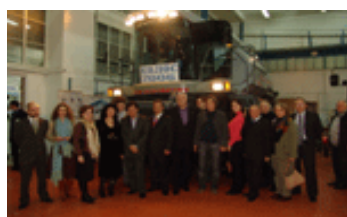
Séminaire octobre 2006

> Consulter l'ensemble des compte-rendus de séminaires