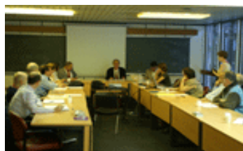
Séminaire juin 2005