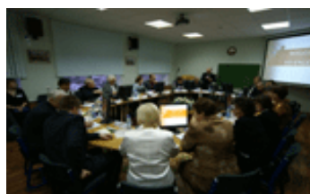
Séminaire de décembre 2007 à Vologda