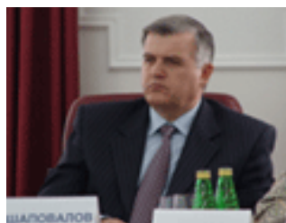
Séminaire octobre 2006 : M. Chapovalov, ministre des Finances de la région fédérale de Stavropol

– XXIe session : Dilemmes et perspectives de l'économie russe à l'été 2001 Paris, juillet 2001