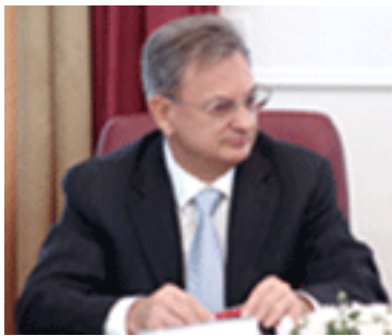
Séminaire octobre 2006 : Vladimir I. Trukatchev, recteur de l'Académie agraire de Stavropol

Ce dernier s'est délocalisé hors de Paris et Moscou à plusieurs reprises. Le séminaire s'est ainsi déroulé à Lyon (2003), à Saint-Pétersbourg (2001), Rostov (2002), Kislovodsk (2005), Stavropol (2006), Vologda (2007).